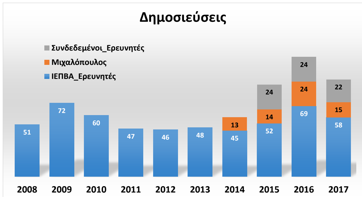
Εικόνα 1: Μεταβολή του αριθμού των δημοσιεύσεων σε περιοδικά με κριτές κατά την διάρκεια της περιόδου 2008-2017. Η συνεισφορά από συνδεδεμένους ερευνητές και τον υπογράφο αναφέρεται ξεχωριστά.